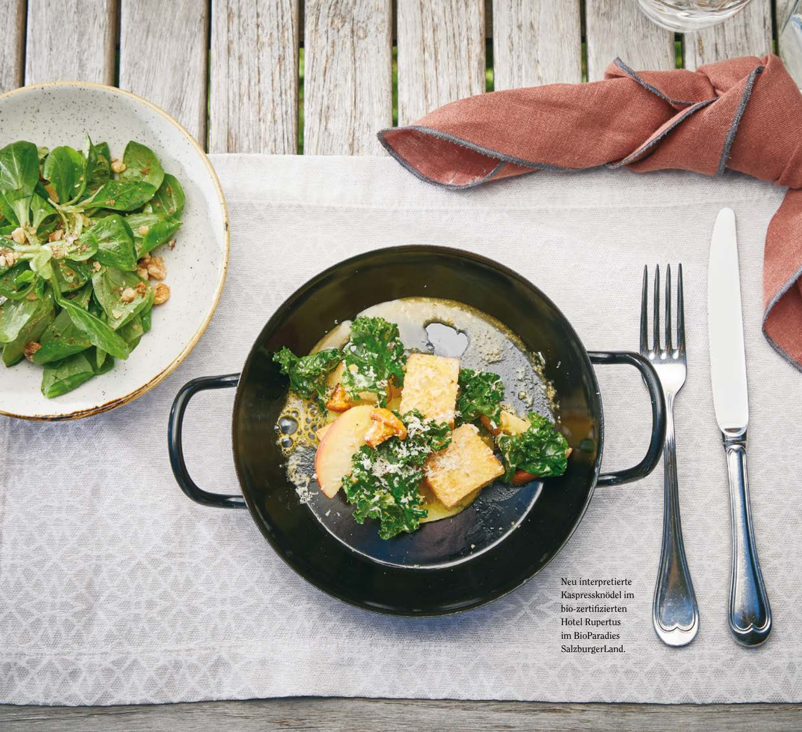
Neu interpretierte Kaspressknödel im bio-zertifizierten Hotel Rupertus im BioParadies SalzburgerLand.