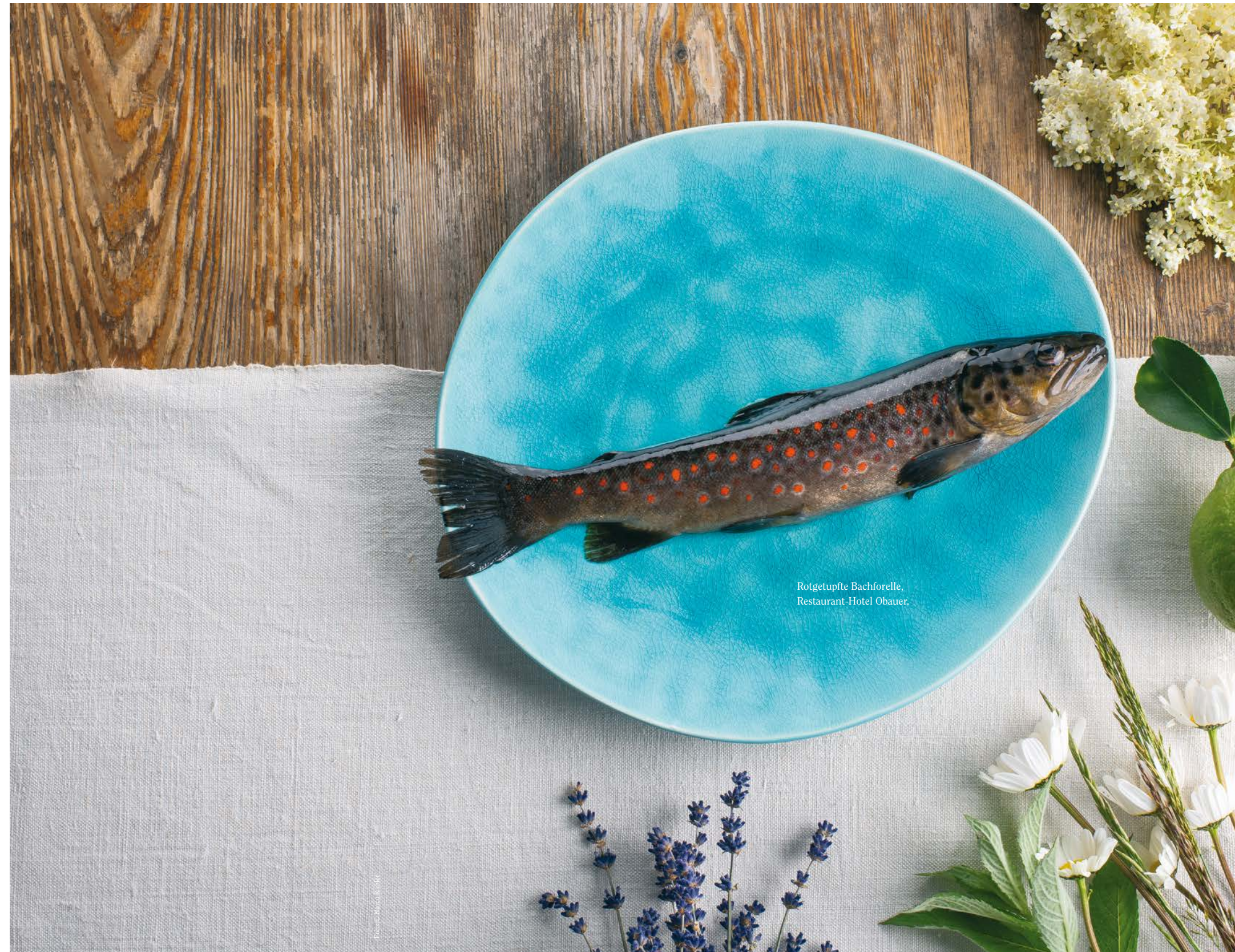
Rotgetupfte Bachforelle, Restaurant-Hotel Obauer.

Die Vision einer Spitzendestination. Gutes Essen und Trinken zählen zu wichtigen Reisemotiven, wenn es darum geht, einen Urlaub zu planen. Kaum ein anderer sinnlicher Genuss vermag eine Destination so eindrücklich zu vermitteln wie das, was sich Gäste sprichwörtlich schmecken lassen. Mithilfe der authentischen Alpenen Küche soll das SalzburgerLand international als Spitzendestination im Bereich Kulinarik etabliert werden. Schon jetzt eilt unseren Gastronomen und Köchen ein hervorragender Ruf voraus. Die Alpine Küche soll als ein Top-Angebot weltweit bekannt gemacht werden. ❖